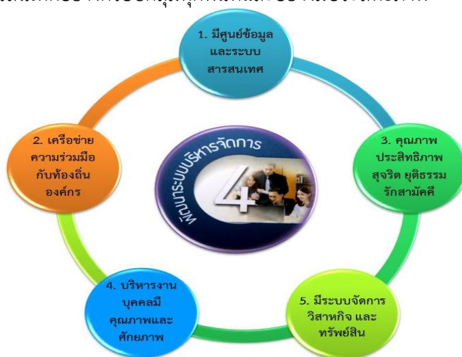
ภาพที่ 11 ประเด็นยุทธศาสตร์ที่ 4 พัฒนาระบบบริหารจัดการและความสอดคล้องเป้าประสงค์

มหาวิทยาลัยราชภัฏร้อยเอ็ดมุ่งเน้น และให้ความสำคัญในการใช้หลักการบริหารจัดการองค์กรที่ดีใช้หลักธรรมาภิบาลควบคู่กับ LERT 4.0 Model ปรับปรุง และพัฒนาระบบสวัสดิการเพื่อสนับสนุนกิจการของมหาวิทยาลัย เน้นการสร้างเครือข่ายเพื่อพัฒนางานด้านต่าง ๆ เป็นสถาบันการศึกษาเพื่อพัฒนาท้องถิ่น พัฒนา ศูนย์ข้อมูลและระบบสารสนเทศที่มีประสิทธิภาพและทันสมัย ส่งเสริม สนับสนุนนักศึกษาและบุคลากร ให้เข้าถึงระบบข้อมูลและสารสนเทศอย่างครอบคลุมทุกพื้นที่และอย่างมีประสิทธิภาพ